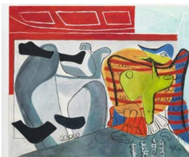
LE CORBUSIER La-Chaux-de-Fonds 1887-1965 Roquebrune-Cap Martin CHARLES-EDOUARD JEANNERET

Zuschlag (inkl. Aufgeld) CHF 168'000 | EUR 140'000 | USD 186'667