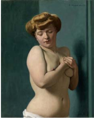
FELIX VALLOTTON Lausanne 1865-1925 Neuilly