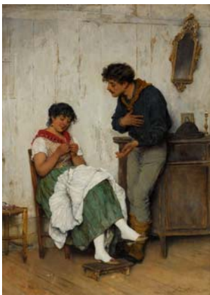
EUGEN VON BLAAS Albano bei Rom 1843-1931 Venedig

Zuschlag (inkl. Aufgeld) CHF 192'000 | EUR 160'000 | USD 213'333